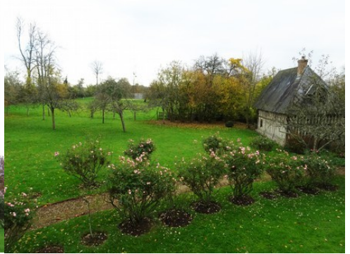
La vue vers le jardin à l'Est