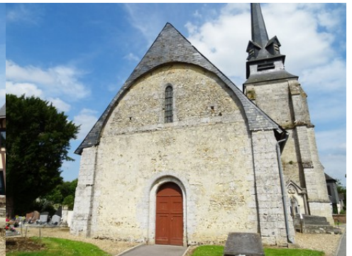
Quelques vues rapprochées de l'église