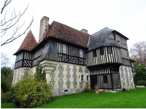
Une vue de la façade est