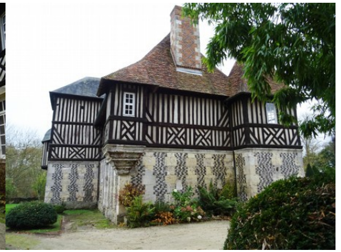
La façade nord