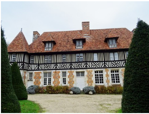
La façade ouest du manoir