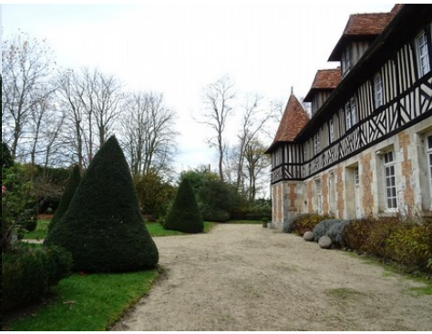
La façade du manoir et son parc