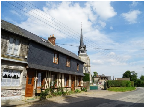
Les abords de l'église

Les avis seront cohérents avec ceux émis ces dernières années, à savoir : pas de maisons à volume compliqué (type V, W, Y, ou Z), pentes à 45° pour les volumes principaux, ardoise ou tuile plate de teinte brun vieilli, à 20u/m 2 , avec un débord de toiture de 20cm, enduit de teinte beige clair avec modénatures (au choix : chaînages, encadrement de fenêtres, soubassement, colombage...). *Voir les autres fiches.