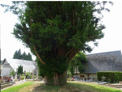
L'if du cimetière