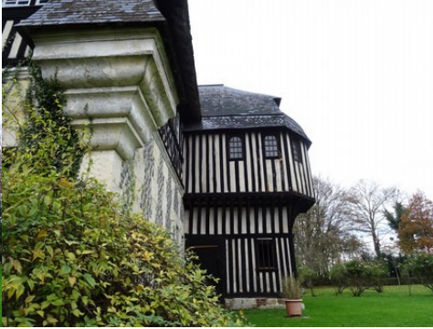
Une vue rapprochée de l'angle sud-est